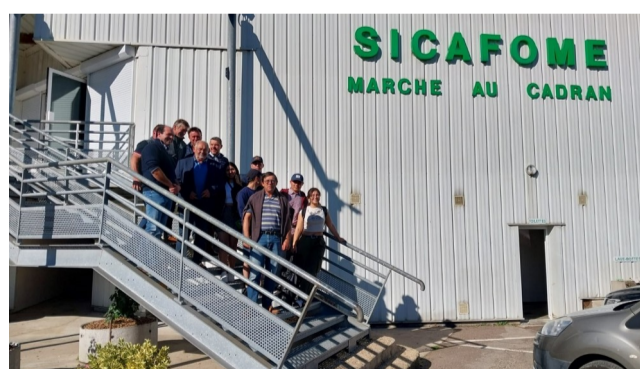
Marché au Cadran