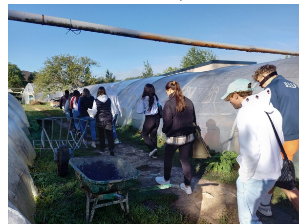
Les Jardins Bio