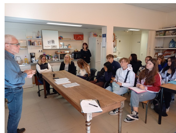
Les Z'amis du panier