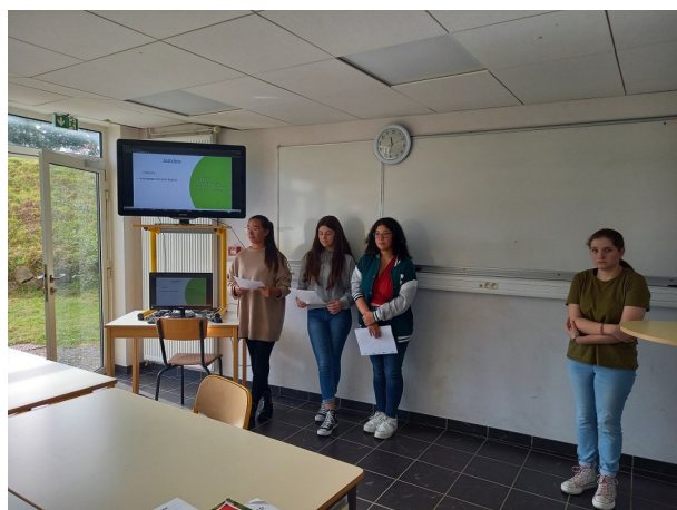
Restitution en salle

La dernière demi-journée a été consacrée à un exercice formateur : restitution en salle par les élèves au cours duquel chacun a pu appréhender les conditions d'un oral d'examen.